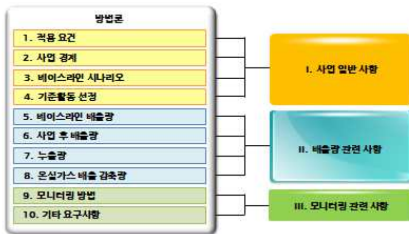
Fig 2. Methodology structure.

국내 온실가스 배출감축사업의 등록을 위해서는 사업계획서를 작성해야 한다. 사업계획서를 작성하기 위해서는 방법론을 참고해야 하는데 방법론은 구성 항목에 따라 크게 사업 일반 사항, 배출량 관련 사항, 모니터링 관련 사항으로 나눌 수 있다. 각 항목별로 배출량을 계산하기 위하여 적용되는 기준, 가정, 계산방법, 절차 등이 자세히 서술되어 있다.