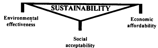
Fig. 1. Sustainability balances Environment, Economy and Society

고형 폐기물 관리는 지속가능한 개발의 3대 축(그림 1) 즉, 환경적으로 효과적이고, 경제적으로 지원 가능해야 하며 사회적으로 수용 가능해야 한다.