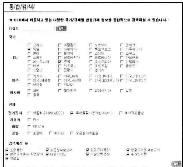
그림 3. 통합검색 화면

국에 수출할 경우를 예로 들면, 그림 3과 같이 종합정보시스템의 통합검색에서 해당 지역과 전기전자산업 분야 환경규제를 선택할 수 있으며, 검색결과로 독일과 영국에서 WEEE 지침과 RoHS지침이 시행되고 있다는 점을 확인할 수 있다.