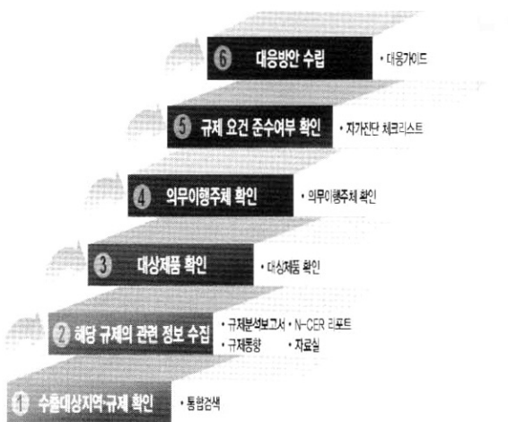
그림 2. 기업의 환경규제 대응절차에 따른 종합정보시스템 활용도

정보, N-CER리포트, 자료실이 이용될 수 있다. 3) 대상제품확인 단계, 4) 의무이행주체 단계와 5) 규제요건 준수여부 확인 단계에서는 사전평가가 각 단계별로 활용될 수 있다. 6) 대응방안 수립 시에는 사전평가의 자가진단체크리스트 결과인 대응가이드가 최종적으로 이용될 수 있다. 이와 같은 내용은 그림 2와 같이 나타낼 수 있다.